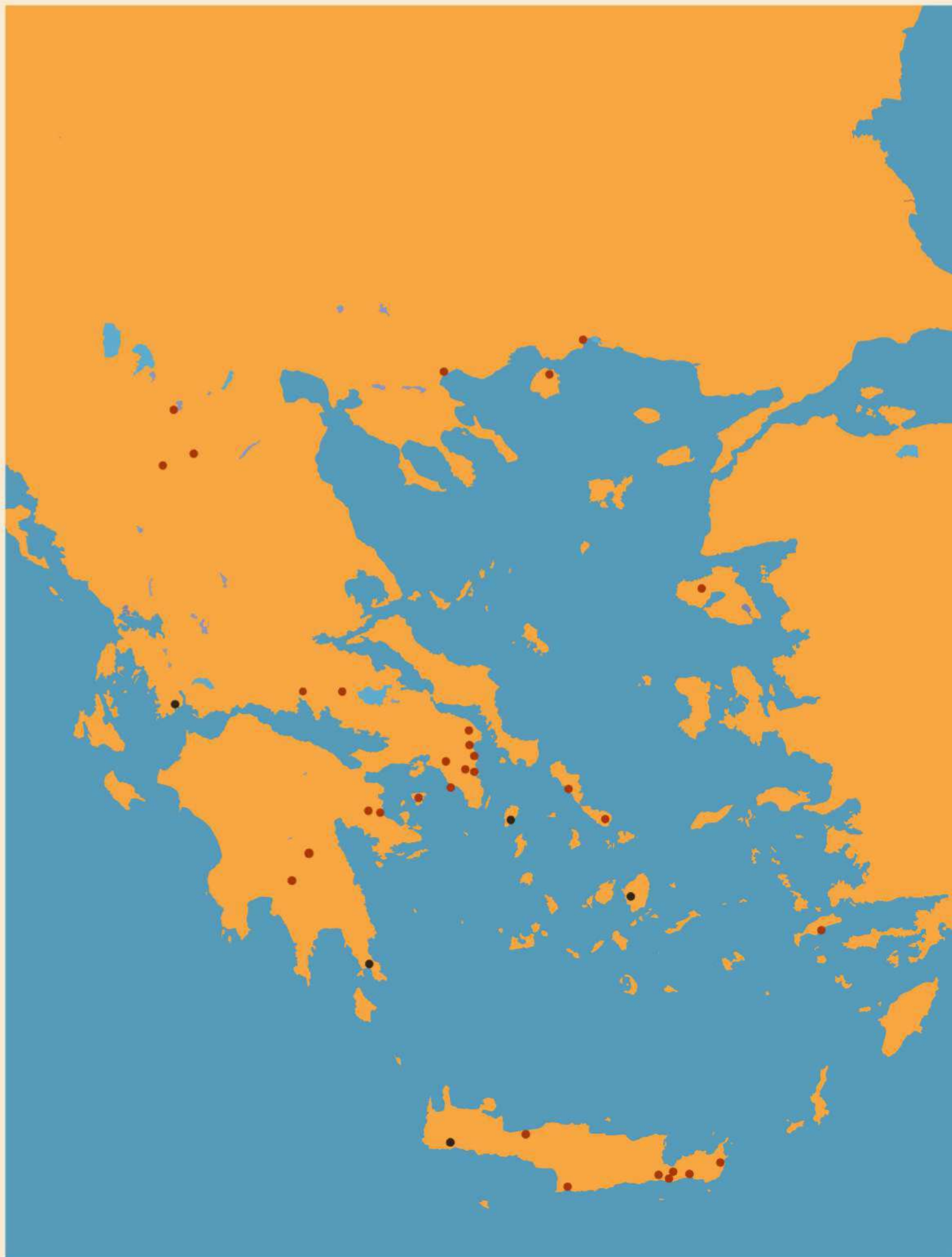
Τοποθεσίες ερευνητικής δραστηριότητας του Τομέα Αρχαιολογίας και Ιστορίας της Τέχνης στην Ελλάδα. Sites of ongoing research in Greece by the Section of Archaeology and History of Art