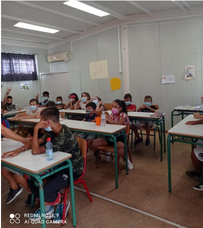
1ο ΔΣ ΓΕΡΑΚΑ-ΜΑΘΗΜΑΤΑ ΓΡΑΜΜΑΤΙΣΜΟΥ