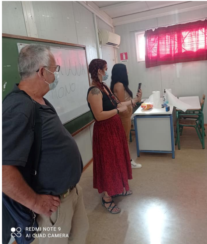
ΜΑΘΗΜΑΤΑ ΓΡΑΜΜΑΤΙΣΜΟΥ-1ο ΔΣ ΓΕΡΑΚΑ