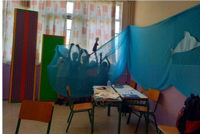
ΕΝΙΣΧΥΤΙΚΕΣ ΠΑΡΕΜΒΑΣΕΙΣ ΣΤΗΝ ΠΕΡΙΟΧΗ ΤΗΣ ΑΘΗΝΑΣ- 64ο ΔΣ ΑΘΗΝΩΝ