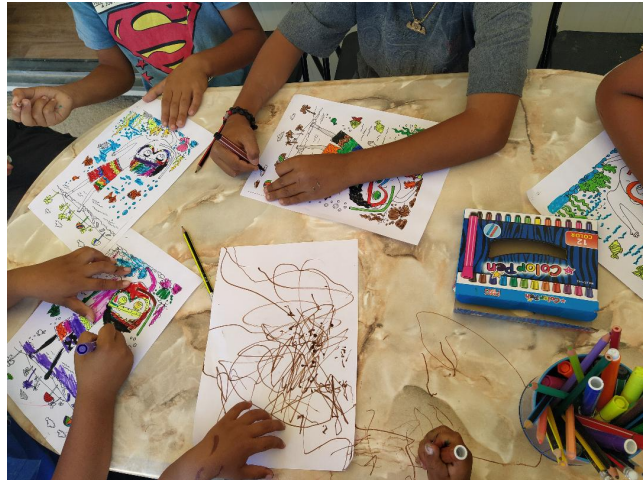
ΜΑΘΗΜΑΤΑ ΓΡΑΜΜΑΤΙΣΜΟΥ - ΚΑΤΑΓΛΙΣΜΟΣ ΚΙΑΦΑ- ΣΠΑΤΑ