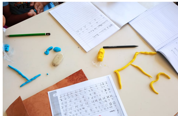
ΕΚΠΑΙΔΕΥΤΙΚΕΣ ΠΑΡΕΜΒΑΣΕΙΣ ΣΤΗΝ ΠΕΡΙΦΕΡΕΙΑ ΚΡΗΤΗΣ