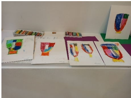
ΕΠΙΣΚΕΨΗ ΣΤΗ ΠΙΝΑΚΟΘΗΚΗ ΔΗΜΟΥ ΑΘΗΝΑΙΩΝ-64ο ΔΣ ΑΘΗΝΩΝ