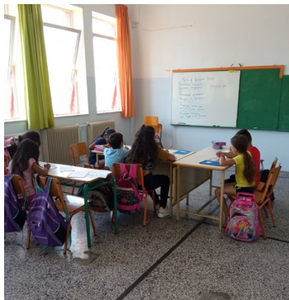
ΕΝΙΣΧΥΤΙΚΕΣ ΠΑΡΕΜΒΑΣΕΙΣ-17ο ΔΣ ΧΑΝΙΩΝ-ΠΕΡΙΦΕΡΕΙΑ ΚΡΗΤΗΣ