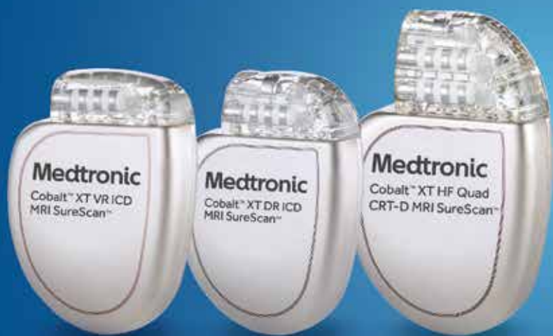
Cobalt™ XT VR ICD MRI SureScan™

Meet Cobalt™ XT, Cobalt™, and Crome™ ICD and CRT-D Portfolio