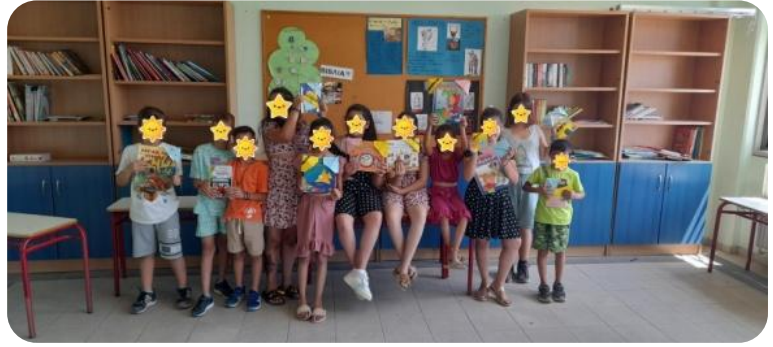
Εικόνα 7 & 8. ΘΕΡΙΝΑ ΜΑΘΗΜΑΤΑ ΣΕ ΔΗΜΟΤΙΚΑ ΣΧΟΛΕΙΑ ΤΗΣ ΑΘΗΝΑΣ