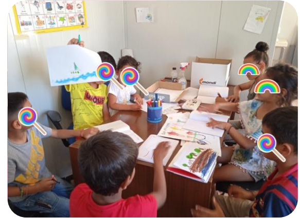
Εικόνες 3 & 4. ΜΑΘΗΜΑΤΑ ΓΡΑΜΜΑΤΙΣΜΟΥ ΚΑΤΑΓΛΙΣΜΟΣ ΚΙΑΦΑ-ΣΠΑΤΑ