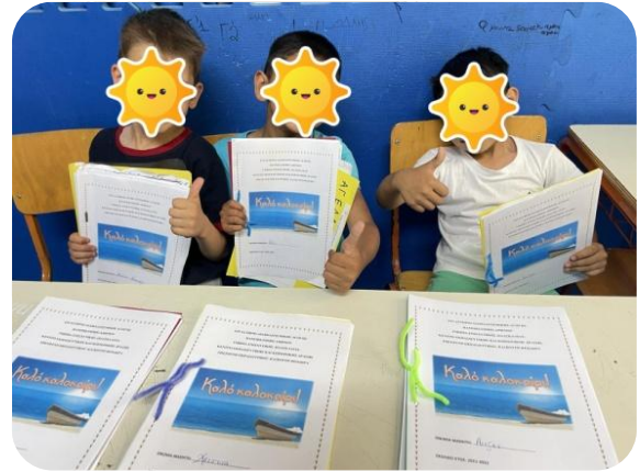
Εικόνες 1 & 2. ΜΑΘΗΜΑΤΑ ΓΡΑΜΜΑΤΙΣΜΟΥ ΣΕ ΣΧΟΛΙΚΗ ΜΟΝΑΔΑ ΚΑΙ ΜΚΟ