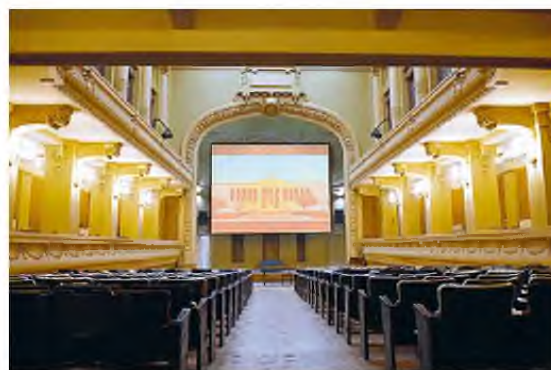
Η αποκατεστημένη αίθουσα «Ιρις».

τη θητεία του έχει σκύψει με έγνοια στο κτιριακό απόθεμα του Πανεπιστημίου Αθηνών, ώστε αυτό να αξιοποιηθεί με τον καλύτερο τρόπο. Σύμφωνα με την ανακοίνωση του ιδρύματος, η αποκατάσταση που πραγματοποιήθηκε περιλάμβανε εργασίες επισκευής και συντήρησης των εσωτερικών τοιχοματών, βαφή όλης της αίθουσας (πλατεία - εξώστες - οροφή), επισκευή και συντήρηση του δαπέδου στον άνω