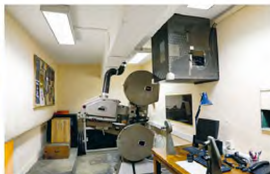
Ο παλιός τεχνολογικός εξοπλισμός αναβαθμίστηκε.

εξώστη, επισκευή και λείανση του μωσαϊκού στο δάπεδο της πλατείας, επισκευή και στίλβωμα του μεγάλου ξύλινου βάθρου της σκηνής και επισκευή - αποκατάσταση των καθισμάτων της αίθουσας. Πραγματοποιήθηκαν επίσης ηλεκτρολογικές εργασίες, όπως επισκευή των φωτιστικών της αίθουσας και της οροφής καθώς και του περιμετρικού φωτισμού, αντικατάσταση των λαμπτήρων με τοποθέτηση λαμπτήρων led,