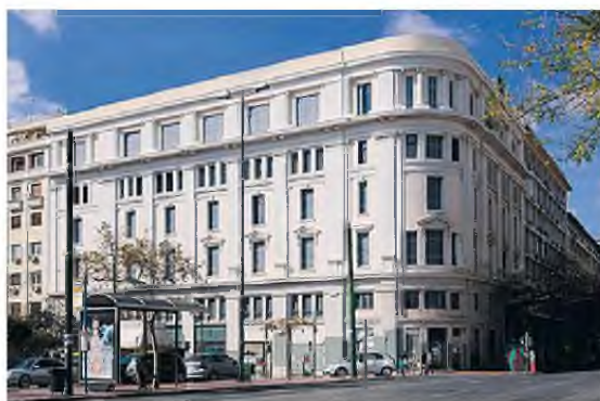
Το θαυμάσιο κτίριο της Πανεπιστημιακής Λέσχης.

Ωστόσο, τα τελευταία χρόνια ο χώρος είχε «γεράσει» και είχε ατονήσει η δραστηριότητά του. «Η ιστορική αίθουσα «Ιρις»