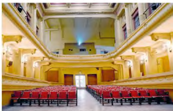
Έγιναν εργασίες φωτισμού και όχι μόνον.

ακτινοβολεί και πάλι στο Εθνικό και Καποδιστριακό Πανεπιστήμιο Αθηνών, καθώς έπειτα από επίμονες προσπάθειες των πρυτανικών αρχών, ύστερα από πολλά χρόνια, επανήλθε στην αρχική της μορφή, με απόλυτο σεβασμό στην αρχιτεκτονική της, αλλά με σύγχρονο εξοπλισμό. Η ιστορική αίθουσα είναι και πάλι σε θέση να φιλοξενήσει εκδηλώσεις», αναφέρει ο πρύτανης του ιδρύματος, Θάνος Δημόπουλος, ο οποίος κατά