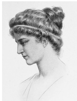
Αφιερωμένο στην Υπατία (370–415)