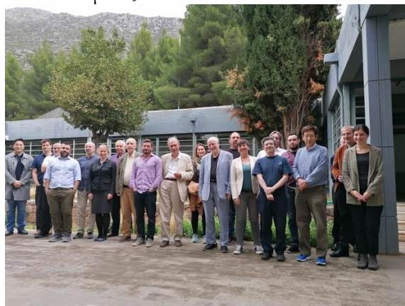
Οι σύνεδροι του Συμποσίου Αρχαίων Ελληνικών Μαθηματικών στους Δελφούς

Κέντρο Δελφών φιλοξένησε έναν εξαιρετικά σημαντικό θεσμό για τα αρχαία ελληνικά μαθηματικά. Πρόκειται για τα « Διεθνή Συμπόσια των Δελφών », έναν ιστορικό θεσμό διεθνών συναντήσεων που λειτουργήσε κατά τα έτη 1992-2002 και συνέβαλε, όσο κανένας άλλος θεσμός, στην αναζωογόνηση του ενδιαφέροντος της ιστορικής κοινότητας για τα αρχαία ελληνικά μαθηματικά. Το Συμπόσιο διοργανώθηκε από το Τμήμα Ιστορίας και Φιλοσοφίας της Επιστήμης (Επιστημονικοί Υπεύθυνοι: Ομότιμος Καθηγητής Γιάννης Χριστιανίδης και Αναπληρωτής Καθηγητής Μιχάλης Σιάλαρος ) και το Τμήμα Κλασικών Σπουδών του Πανεπιστημίου Stanford (Επιστημονικός Υπεύθυνος: Καθηγητής Reviel Netz ). Το έργο υποστηρίχθηκε από το Ελληνικό Ίδρυμα Έρευνας και Καινοτομίας.