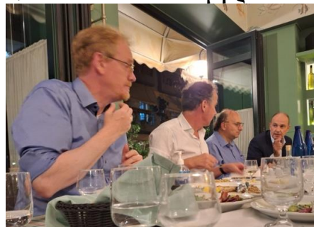
Δείπνο ομιλητών μετά το πέρας της πρώτης ημέρας του συνεδρίου

ομιλητές από την Γαλλία, την Γερμανία, την Ελλάδα, την Ιταλία και τη Νορβηγία. Το συνέδριο έλαβε χώρα στο Κτήριο «Κωστής Παλαμάς» μεταξύ 28 και 29 Σεπτεμβρίου 2023 .