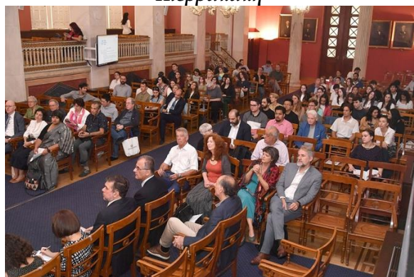
Η κατάμεστη κεντρική Αίθουσα του ΕΚΠΑ

φιλοσοφία (“Athens in Ancient Philosophy”) και διεξήχθη στο κεντρικό κτήριο του ΕΚΠΑ το διήμερο 5-6 Οκτωβρίου 2023 . Στο συνέδριο μετείχαν ομιλητές από όλο τον κόσμο: ΗΠΑ, Βραζιλία, Ινδία, Ηνωμένο Βασίλειο, Βέλγιο, Γερμανία και Ελλάδα. Οι εργασίες του διεξήχθησαν στην αγγλική και το πλήρες πρόγραμμα έχει αναρτηθεί στον ιστοχώρο του Προγράμματος. Την εναρκτήρια συνεδρία χαιρέτισε ο Υπουργός Παιδείας, Θρησκευμάτων και Αθλητισμού κ. Κυριάκος Πιερρακάκης .