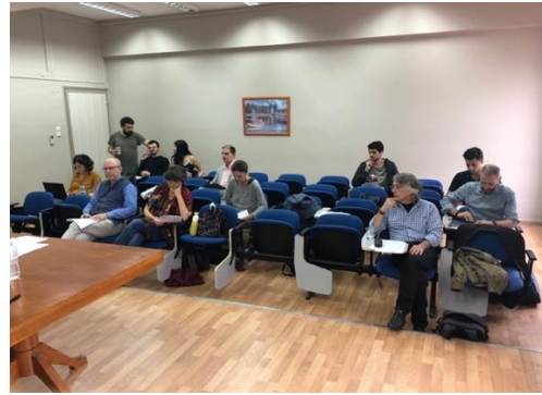
Συνοεδροι, “Colours in Ancient Medicine”

λογίας) ένα διεθνές συνέδριο δύο ημερών με θέμα “Colours in Ancient Medicine” . Στο συνέδριο έλαβαν μέρος ομιλητές από τη Γαλλία, τη Γερμανία, την Ελλάδα, το Ηνωμένο Βασίλειο, το Ισραήλ και την Ιταλία. Το συνέδριο έλαβε χώρα στο Πανεπιστήμιο Πατρών στις 3 και 4 Νοεμβρίου 2023 .