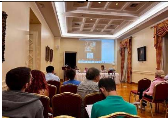
Συνεδροί και κοινό από την εκδήλωση «Θεραπευτικές Προσεγγίσεις στην Αρχαία Ελλάδα και την Κίνα» στο Κτήριο «Κωστής Παλαμάς»

• Το Κέντρο Μελέτης Αρχαίου Ελληνικού & Κινεζικού Πολιτισμού σε συνεργασία με το ΙΦΕ διοργάνωσαν με μεγάλη επιτυχία μία διεθνή συνάντηση εργασίας δύο ημερών με θέμα τις Θεραπευτικές Προσεγγίσεις στην Αρχαία Ελλάδα και την Κίνα . Στο συνέδριο μίλησαν ερευνη-