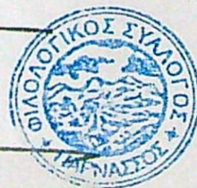
ΒΑΣ. Α. ΚΩΝΣΤΑΝΤΙΝΟΠΟΥΛΟΣ Καθηγητὴς Πανεπιστημίου