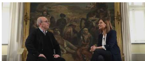
Συνέντευξη, Καθηγητής Αριστέιδης Χατζής, Εκπομπή «Μεγάλη Εικόνα», Mega.

• Ο Καθηγητής του ΙΦΕ Αριστέιδης Χατζής μίλησε στην εκπομπή του Mega «Μεγάλη Εικόνα» και την κ. Νίκη Λυμπεράκη με αφορμή την Εθνική Επέτειο της 25ης Μαρτίου 1821. Απαρχή της συζήτησής τους στάθηκε ο τίτλος του βιβλίου του Καθηγητή κ. Χατζή για την Ελληνική Επανάσταση