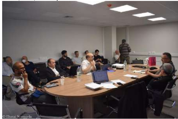
Συνεδροι, «Θεϊστική Μεταφυσική»

επιχειρημάτων μεταξύ των παρευρισκόμενων.