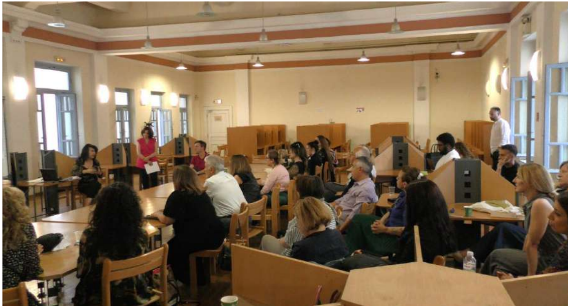
Στιγμιότυπα από την εναρκτήρια συνάντηση της «Θυμέλης» στις 25 Μαΐου 2024

ΠΑΝΕΠΙΣΤΗΜΙΟ ΠΕΛΟΠΟΝΝΗΣΟΥ UNIVERSITY of the PELOPONNESE