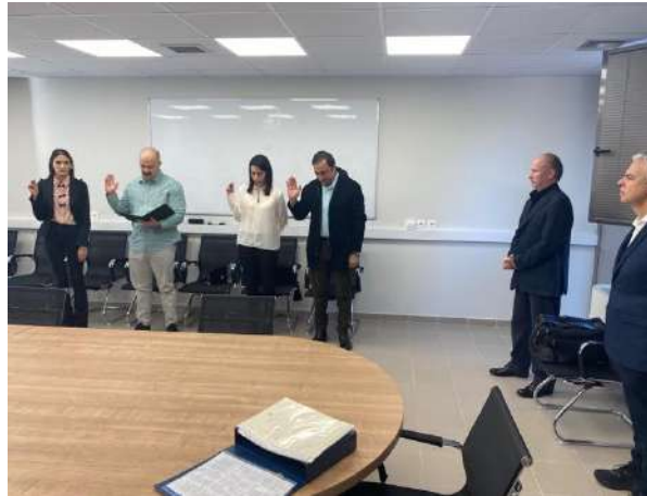
Ορκωμοσία Μεταπτυχιακών Φοιτητριών και Φοιτητών του ΠΜΣ ΙΦΕΤ