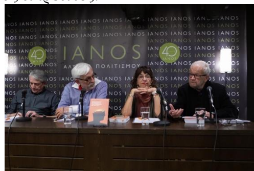
Στιγμιότυπο από την Εκδήλωση στον Ιανό

• Την Τριτη 13 Μαρτίου 2025 και ώρα 19.30 στον ΙΑΝΟ (Σταδίου 24) έγινε η παρουσίαση του βιβλίου του Ηλία Κούβελα , Ομότιμου Καθηγητή Φυσιολογίας της Ιατρικής Σχολής του Πανεπιστημίου Πατρών, με τίτλο « Ιχνηλατώντας τα μονοπάτια του εγκεφάλου και του νου » που εκδόθηκε πρόσφατα από τις εκδόσεις Καστανιώτη. Ομιλητές ήταν η Καθηγήτρια του ΙΦΕ Ειρήνη Σκαλιώρα , ο Σπύρος Μητροσύλης και ο Δημοσθένης Αγραφιώτης . Το βιβλίο απευθύνεται στο ευρύ κοινό και προβλέπεται να υπάρξει συζήτηση με τους ακροατές.