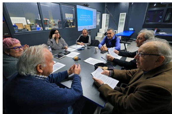
Συμμετέχουσες/χοντες σε ένα από τα εργαστήρια συν-διαμόρφωσης δίκαιων μεταβάσεων

Η ερευνητική ομάδα του Go-JuST θα επεξεργαστεί όλες τις θέσεις και προτάσεις που συγκεντρώθηκαν, ώστε να διαμορφώσει ένα ολοκληρωμένο τελικό κείμενο, το οποίο θα αξιοποιηθεί από την Περιφέρεια Θεσσαλίας , στο πλαίσιο του σχεδιασμού του νέου αγροτικού μοντέλου της περιοχής, συμβάλλοντας στη δημιουργία ενός πιο βιώσιμου, ανθεκτικού και κοινωνικά δίκαιου αγροδιατροφικού συστήματος. Η ενεργή συμμετοχή των αγροτών και των συνεταιρισμών σε αυτή τη διαδικασία αποδεικνύει τη σημασία