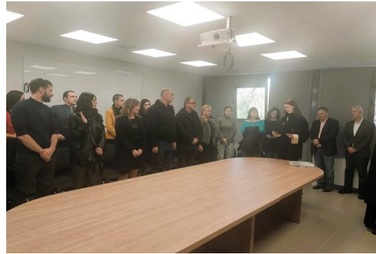
Ορκωμοσία Μεταπτυχιακών Φοιτητριών και Φοιτητών ΔΠΜΣ