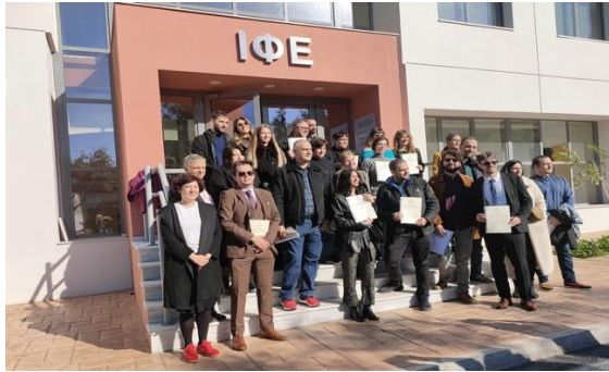
Ομαδική Φωτογραφία Μεταπτυχιακών Φοιτητριών και Φοιτητών ΔΠΜΣ μπροστά από το Νέο Κτήριο ΙΦΕ