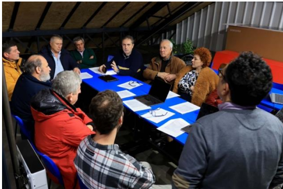
Συμμετέχουσες/χοντες σε ένα από τα εργαστήρια συν-διαμόρφωσης δίκαιων μεταβάσεων μαζί με τον επιστημονικό υπεύθυνο του προγράμματος Καθηγητή Στάθη Αραποστάθη

Καρδίτσα και τον Βόλο , αγρότες, μέλη αγροτικών συνεταιρισμών και ΤΟΕΒ συμμετείχαν ενεργά σε ημερίδες που λειτούργησαν ως ανοιχτή διαβούλευση και πραγματοποιήθηκαν υπό την αιγίδα της Περιφέρειας Θεσσαλίας .