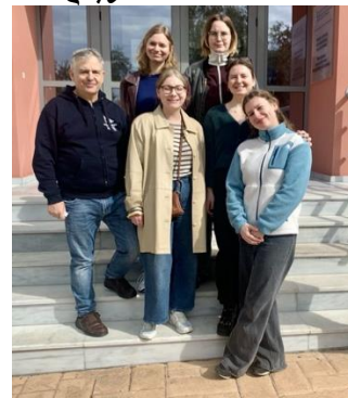
Φωτογραφία μελών της ομάδας με τον Διευθυντή του ΔΠΜΣ, καθηγητή Τέλη Τύμπα, μπροστά από το Νέο Κτήριο ΙΦΕ

την Πολωνία, ενώ σπουδάζουν στο πλαίσιο του ESST στο Πανεπιστήμιο του Μάαστριχτ.