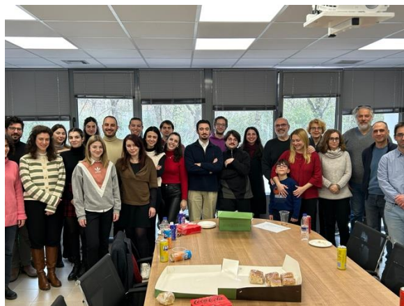
Κοπή πρωτοχρονιάτικης πίτας Εργαστηρίου

• Τα μέλη του Εργαστηρίου έκοψαν τη βασιλόπιτα στις 12 Φεβρουαρίου.