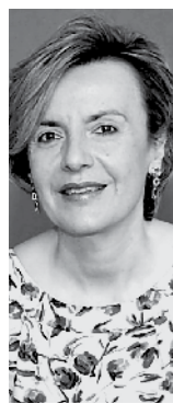
Της Ευαγγελίας Χαρμανδάρη

Καθηγήτριας Παιδιατρικής - Παιδιατρικής Ενδοκρινολογίας στην Ιατρική Σχολή του Πανεπιστημίου Αθηνών και Προέδρου της Ελληνικής Εταιρείας Παιδιατρικής και Εφηβικής Ενδοκρινολογίας, Μεταβολισμού και Σακχαρώδους Διαβήτη