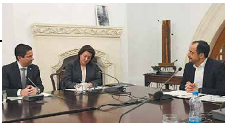
↑ Ο Πρύτανης του Πανεπιστημίου Αθηνών Γεράσιμος Σιάσος (αριστερά) συνομιλεί με την Υπουργό Παιδείας, Αθλητισμού και Νεολαίας της Κύπρου Αθηνά Μιχαηλίδου και τον Πρόεδρο της Κυπριακής Δημοκρατίας Νίκο Χριστοδουλίδη