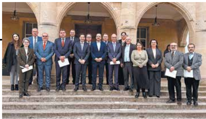
↑ Η πολιτική ηγεσία της Κύπρου και τα μέλη της αντιπροσωπείας του Πανεπιστημίου Αθηνών κατά την πρόσφατη επίσκεψή τους στο νησί