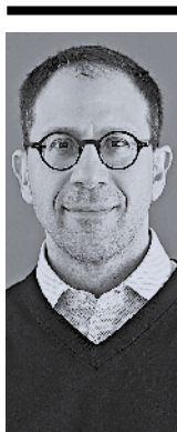
Του Αντώνη Καραπαζού

Και πάλι, βεβαίως, η τελική απόφαση για τις σχετικές επιλογές θα λαμβάνεται από το Υπουργικό Συμβούλιο (ΥΣ). Και